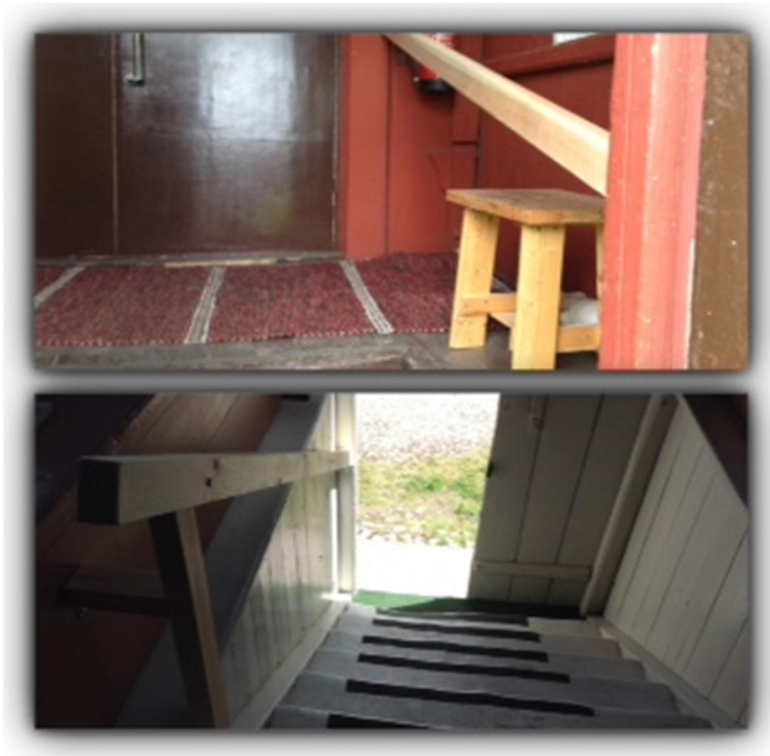
Uudet kaiteet Kerhotalon ja Keltaisen talon portaikoissa